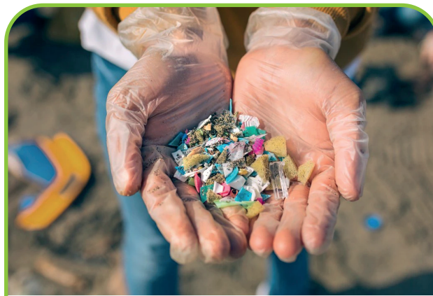
FRAGMENTOS DE PLÁSTICOS