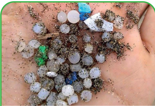
MATERIA PRIMA (PELLETS)

En las playas de Uruguay se han encontrado distintos tipos de microplásticos